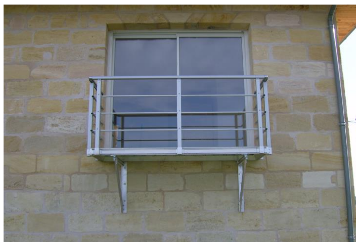
Garde-corps composé d'une lisse, avec 3 sous lisse, sans plinthe. Nous consulter