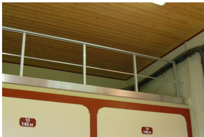
Garde-corps composé d'une lisse, sous-lisse, plinthe